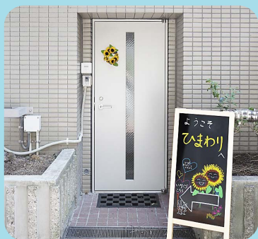
「ひまわり」直通の入口